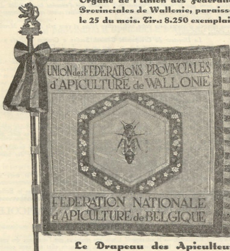
Le Drapeau des Apiculteurs de Wallonie

Organe de l'Union des Fédérations Provinciales de Wallonie, paraissant le 25 du mois. Tir.: 8.250 exemplaires